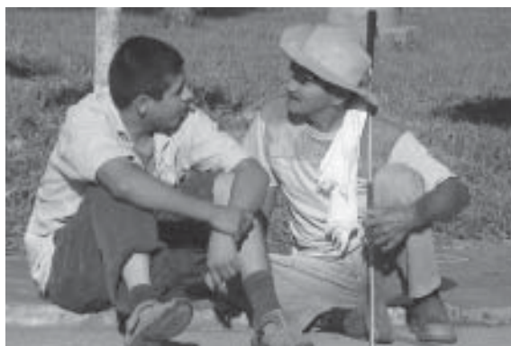
FOTO 20: Sobrevivientes de MAP y MUSE beneficiarios del proyecto de Reintegración Socio Laboral. Bucaramanga. Julio 2006

Los centros de salud en áreas afectadas por minas tienen la infraestructura, los equipos, los suministros y el personal para manejar los accidentes ocurridos por minas. Los hospitales están obligados a brindar ayuda gratis y asistencia inmediata a víctimas de minas y un sistema de comunicación es el que asegura su adecuada rehabilitación. El Estado asume el costo del servicio y la Supervisión Nacional de la Salud monitorea la calidad del servicio. 195