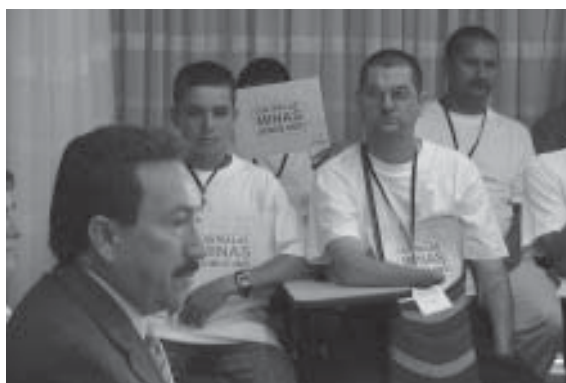
FOTO 23: Lanzamiento del Proyecto de Reintegración Socio Laboral de Víctimas por MAP y MUSE, proyecto financiado por el Reino de Noruega. Bucaramanga. Julio de 2006

El CIREC provee servicios de rehabilitación integrada, así como servicios médicos, apoyo psicosocial, oportunidades educativas y asistencia financiera directa. 216 En el 2005, el CIREC atendió 8.944 pacientes, brindando 2.489 consultas médicas, 3.199 sesiones de terapias físicas y ocupacionales, 446 sesiones psicológicas y 2.810 servicios sociales. El centro produjo 481 prótesis y 4.330 órtesis. El CIREC trató 83 víctimas de minas/MUSE, de las cuales 11 eran militares y 72 civiles; 13 sobrevivientes más fueron referidos por el OAS. El CIREC ofrece servicios móviles de médicos y rehabilitación para asistir a personas con discapacidades en áreas remotas rurales; en el 2005, asistieron 407 personas, brindaron 46 prótesis, 28 órtesis, 67 sillas de ruedas y 95 de apoyo técnico. 217