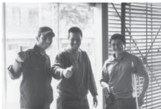
FOTO 16: Víctimas de MAP y MUSE en una estación de Transmilenio. Bogotá. Mayo 2006

El Observatorio utiliza, para registrar las víctimas de minas en Colombia el sistema IMSMA: la información es obtenida de las autoridades departamentales y municipales,