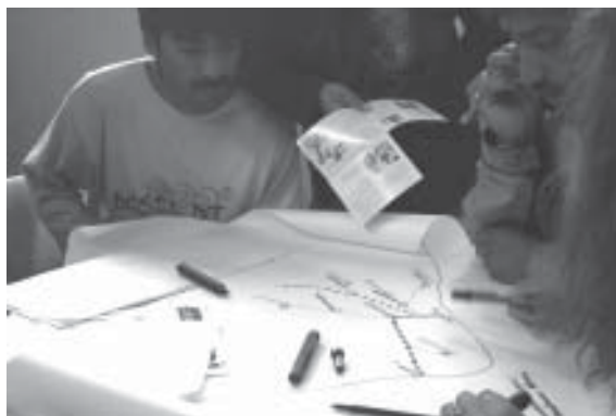
FOTO 8: Taller de sensibilización en el riesgo de Minas a los miembros de la Defensa Civil. Ipiales. Junio 2006

En 2005, la ERM fue asumida por el Observatorio de Minas Antipersonal y algunos gobiernos departamentales con el apoyo de la UNICEF y el PNUD y cinco ONG nacionales, la CCCM, la Corporación Paz y Democracia, la Fundación Antonio Restrepo Barco, el CIREC y la Sociedad de la Cruz Roja Colombiana, apoyados por el Comité Internacional de la Cruz Roja (ICRC). Entre las ONG regionales, Fundemos ya no estaba activa en el 2005; los ex -empleados de Fundemos crearon una nueva ONG,