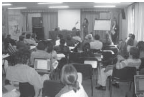
FOTO 19: Encuentro de Instituciones de Salud y entes gubernamentales. Bogotá. Julio 2006

El subcomité técnico del Observatorio de Minas Antipersonal, con respecto a la asistencia a víctimas coordina y monitorea el programa de Prevención para Accidentes con Minas y Asistencia a Víctimas en cooperación con el Ministerio de Protección Social,