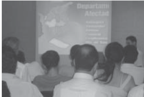
FOTO 1: Foro departamental del Huila contra las Minas. Neiva. Abril 2006

El Monitor de Minas Terrestres obtuvo una copia del Artículo 7 colombiano, del reporte de transparencia en el 2006, fechado en abril de 2006 y cubriendo un periodo de abril de 2005 a marzo de 2006, sin embargo, a 1 de julio de 2006 éste no había sido publicado en la página de Internet de la ONU. Colombia, previamente ha entregado 5 reportes 2 del Artículo 7.