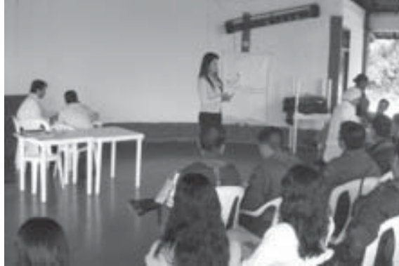
FOTO 10: Taller de Sensibilización sobre el riesgo de Minas. Valle del Cauca. Julio 2006

su llegada a la región del Alto Atrato en el Chocó, un área que está en conflicto, altamente contaminada por artefactos explosivos y en donde hay población que ha sido desplazada. 142