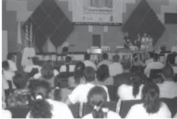
FOTO 24: Primer encuentro departamental de Víctimas del Meta. Villavicencio. Julio 2006

sobrevivientes fueron identificados (cinco de Bolívar y 55 de Antioquia) y 52 de ellos recibieron asistencia. HI tiene un acuerdo con Ortopraxis y la Fundación REI para adaptar las prótesis de los sobrevivientes que no están cubiertos por el Estado porque no tienen la documentación necesaria. El proyecto también brindara pequeños sumas de dinero para proyectos productivos, al menos para 10 de los sobrevivientes identificados. En el 2006, la UNICEF en cooperación con el CIREC y HI pretenden brindar rehabilitación psicológica y física para ellos y apoyar la reintegración socioeconómica de 65 sobrevivientes de minas (40 en Antioquia y 25 en Bolívar). El 6 y 7 de abril de 2006, HI organizó un seminario de entrenamiento para autoridades locales, personas en la rama de la salud, personas que brindan ayuda humanitaria y miembros de la comunidad del Bajo Cauca-región de Cauca, Antioquia, para mejorar los servicios de salud para los sobrevivientes civiles de Minas/MUSE de la región: 17 sobrevivientes participaron. 232