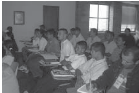
FOTO 15: Segundo Taller impartido a víctimas de MAP y MUSE en el marco del proyecto REVERM. Medellín. Junio 2006

El Monitor de Minas y fuentes informadas en Colombia creen que no hay un registro significativo de los accidentes, puesto que estos no se registran siempre. 172 Los civiles heridos por las minas en zonas rurales, se encuentran en ocasiones muy lejos para recibir servicios médicos y si reciben esos servicios médicos, sus heridas puede que no sean registradas como heridas por minas, por cuestiones de seguridad. Entre octubre de 2005 y el 25 de Julio de 2006, Handicap International (HI) identificó 60