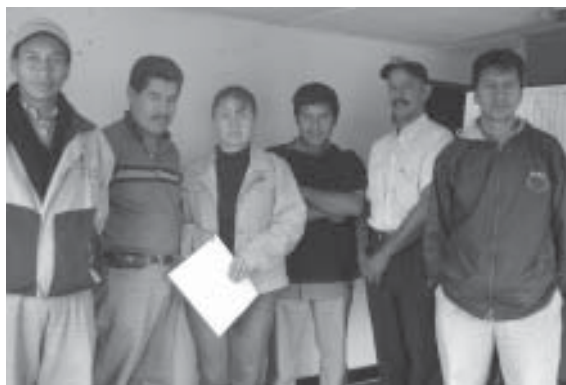
FOTO 11: Corporación Indígena Caucaña Horizontes del Mañana. Organización Indígena en proceso de fortalecimiento dentro del marco del proyecto de sensibilización e información de riesgo de MAP y MUSE, financiado por adopt-a-minefield. Silvia, Cauca. Julio 2006

· Canadá: C$411,000 ($339,249), consistentes en C$161,000 ($132,893) a OAS-AICMA, para monitoreo técnico y de impacto y C$250,000 ($206,356) a UNICEF, para asistencia a víctimas y para la ERM; 151