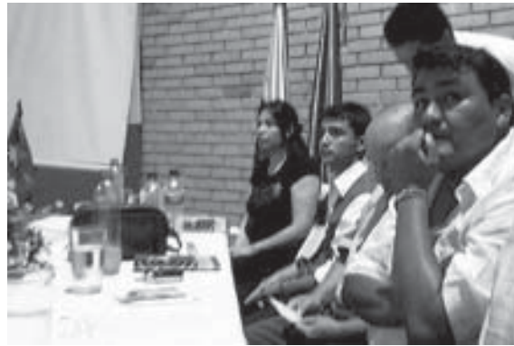
FOTO 2: Taller departamental sobre Minas. De derecha a izquierda: Representantes de acción social, Secretaría de Gobierno, Cruz Roja Colombiana, y Observatorio de Minas de la Vicepresidencia. Yopal, Mayo 2006

Colombia es un Estado Parte de la Convención del Protocolo II Revisado sobre Armas Convencionales, pero no asistió a la Séptima Conferencia Anual de los Estados Parte para el protocolo el 23 de noviembre de 2004 y no ha entregado un reporte del Artículo 13 sobre medidas nacionales para el 2005.