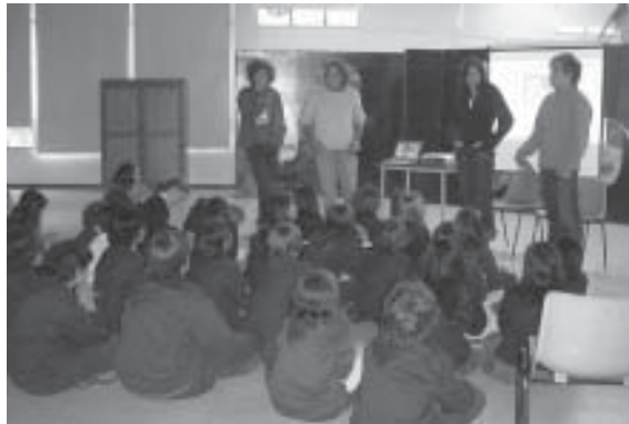
FOTO 14: Taller de Educación en el Riesgo de Minas. Colegio Anglo Colombiano. Bogotá. Mayo 2006

Colombia fue aceptada en el Departamento de Estado de EEUU en el programa humanitario de acción contra minas en septiembre de 2005, que comienza en el 2006. El financiamiento será provisto a través de la OAS en entrenamiento y equipando militarmente a 40 personas en desminado humanitario de emergencia, que tengan la capacidad de responder ante el Observatorio. 168