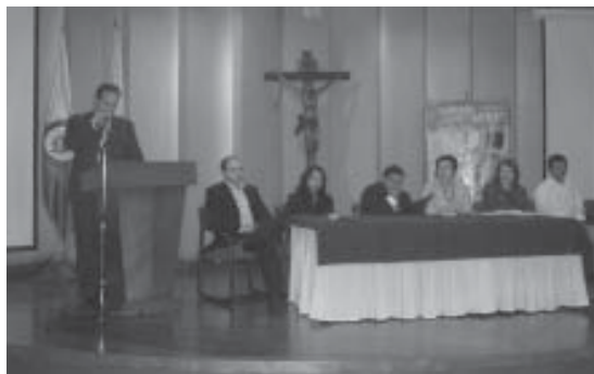
FOTO 7: Primer encuentro departamental de minas. Bogotá. Cundinamarca. Agosto 2006

La ERM en Colombia es limitada por las dificultades en relacionarse con el desminado humanitario o con las operaciones de desminado de emergencia debido al conflicto actual en muchas regiones del país. Según la CCCM, en áreas donde no hay un desminado humanitario o donde hay un uso reciente de minas, no se puede esperar una rápida reducción de incidentes y de víctimas como resultado de la ERM. En donde el conflicto armado es intenso, la población puede tener miedo de dar información. Una ERM significativa bajo estas circunstancias es difícil y solo se puede llevar a cabo si se el uso de dispositivos explosivos, políticas y otras consideraciones son mencionadas. 133