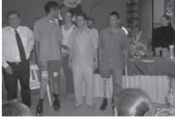
FOTO 12: Entrega de Prótesis fabricadas en el Centro de Rehabilitación del Norte de Santander. Cúcuta. Norte de Santander. Agosto 2006