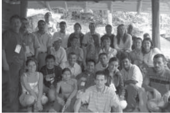
FOTO 13: Grupo de víctimas facilitadores del proyecto REVERM. Medellín. Junio 2006

· Noruega: NOK2,211,283 ($343,303), consistentes en NOK1,050,000 ($163,013) a la CCCM para la ERM, NOK1,097,000 ($170,310) a la CCCM para la reintegración económica a los sobrevivientes de minas y NOK64,283 ($9,980) a la Fundación Antonio Restrepo Barco para la acción contra minas; 155