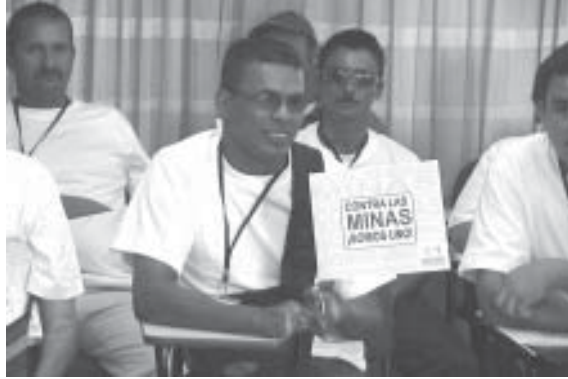
FOTO 18: Víctimas beneficiadas por el proyecto de reintegración sociolaboral. Bucaramanga. Julio 2006

La recolección de los datos se ve obstaculizada por la gran cantidad de personas en situación de desplazamiento interno en Colombia, se estima que ya son 3 millones. No se conoce cuantas víctimas de minas hay entre este grupo y donde están registradas, especialmente si no tienen los documentos que soportan la salida de sus casas. Los sobrevivientes del desplazamiento son los más pobres en Colombia, pues no tienen una red social de seguridad, documentos necesarios para recibir servicios y tienen recursos económicos limitados. La mayoría de la población desplazada en Colombia son niños y mujeres. 186