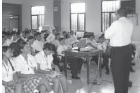
FOTO 9: Taller de sensibilización a niños y niñas de colegios. Casanare. Septiembre 2006

Tierra de Paz en 2005 con el apoyo de la ONG alemana Diakonie Emergency Aid e iniciaron las actividades de la ERM en varios municipios del Cauca. Adopta un Campo minado (adopt-a-minefield) apoya otra ONG local brindándoles la ERM en el departamento del Cauca. 136