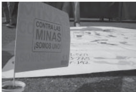
FOTO 6: Actividad de sensibilización sobre la Convención de Ottawa y el problema de minas en el departamento de Caldas. Manizales. Agosto 2006.

Colombia utiliza el Sistema Administrador de Información para la Acción Contra Minas (IMSMA), que fue instalado por el Centro Internacional para el Desminado Humanitario de Ginebra (GICHD) en el 2002. 86 Colombia planea descentralizar la base de datos del IMSMA a un nivel departamental, iniciando con los que están más afectados. Colombia maneja un sistema variado, utilizando la última versión de forma 3 y algunos componentes de la versión 4, permitiendo la descentralización del sistema. 87 El proyecto es apoyado por el GICHD y la Organización Internacional para las Migraciones (OIM). 88 Desde junio de 2006, 15 computadores han sido adquiridos e instalados en los comités departamentales para la acción integrada en contra de las minas, con entrenamiento de algunos de los comités. 89