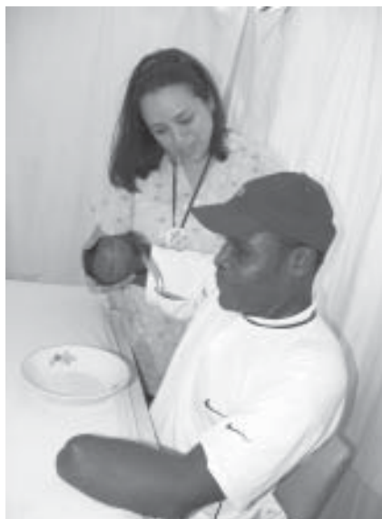
FOTO 22: Víctima de MAP. Centro de Rehabilitación del Hospital Universitario del Valle. Cali. Julio 2006.

Los servicios de rehabilitación física están disponibles en las ciudades grandes; servicios, más no alojamiento y transporte, estos son gratis por máximo un año. El Ministerio de Protección Social cubre los costos de la primera prótesis u órtesis; en algunas ocasiones las autoridades locales cubren el costo del reemplazo. El acceso al servicio es limitado debido a la ubicación de los centros, una falta de conocimiento de la disponibilidad de los servicios y