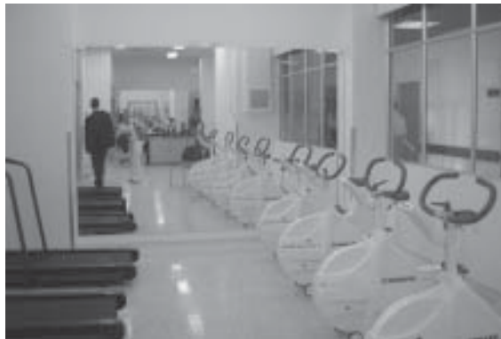
FOTO 5: Nuevo Centro de Rehabilitación del Hospital Universitario del Valle. Cali. Julio 2006.

Autoridad Nacional de Acción Contra Minas: La Comisión Nacional Interministerial en la Acción Contra Minas Antipersonal (CINAMA) se fundó el 8 de octubre de 2001. 75 CINAMA es responsable de la implementación del Tratado Contra las Minas, incluyendo el desarrollo de un plan nacional, decisiones de políticas y coordinación de la cooperación internacional. La comisión tiene dos comités técnicos, uno para asistencia a víctimas y el otro para prevención, marcación y mapeo y desminado. 76 CINAMA se reúne dos veces al año para discutir el progreso y los planes. La siguiente reunión será para el 18 de julio de 2006. 77